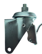
GE 512 FR