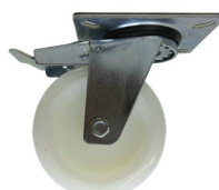
GB 512 FR