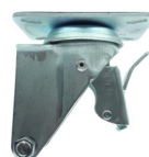
GB 512 FR